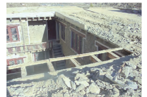
エコミュージアム修繕状況